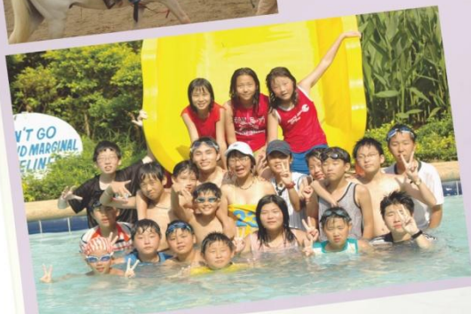
Beach Resort 캠핑 1회

전형적인 필리핀의 아열대성 기후를 만끽하면서 하이픈한 학습 관리로 인한 스트레스를 해소하고 좋은 추억을 만들기 위한 프로그램