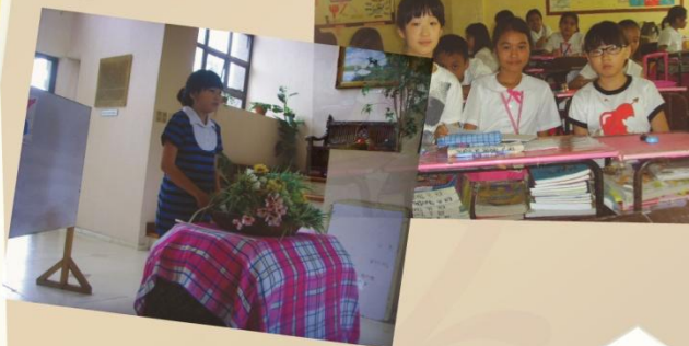
Speech Contest 1회

팀별 영어 골드볼 게임을 통 해 협력을 다짐하 동시에 영어 생활화에 도움을 주기 위한 Activity