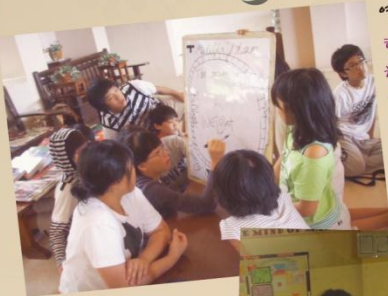
영어 토론 2회

필리핀 대통령 여름 별장 Mansion House, Mines View, 빈헨타크, 캄존헤이, PMA 등 바기오 유명 관광지 탐방