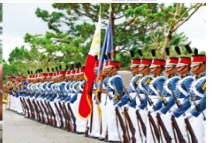
필리핀 삼군 사관학교