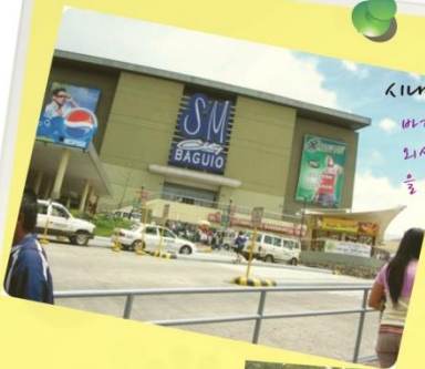
시내외 출몰 및 쇼핑 매주 일요일

바기오 최대 쇼핑몰인 SM 쇼핑몰에서 쇼핑, 외식, PC방 이용, 영화 관람 등의 자활활동 을 즐기며 한주간의 스트레스를 해소