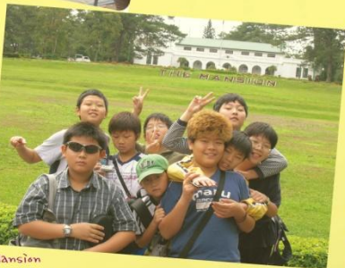
City Tour 1회

바기오 최대 쇼핑몰인 SM 쇼핑몰에서 쇼핑, 외식, PC방 이용, 영화 관람 등의 자활활동 을 즐기며 한주간의 스트레스를 해소